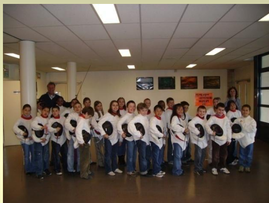
Photo souvenir du cycle d'escrime